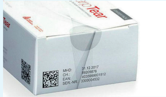
Zegels of stickers (met of zonder hologram)