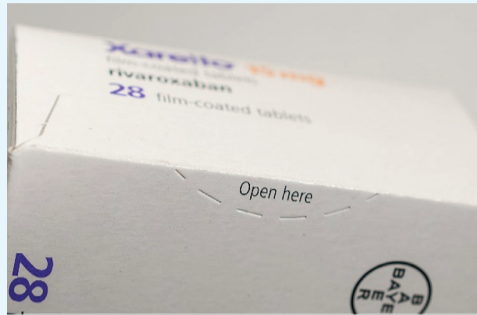
Doosje dicht gelijmd (met perforaties)

VERZEGELING IS ALTIJD AANGEBRACHT OP DE BUITENSTE VERPAKKING