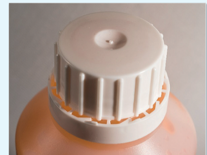
Draai en open