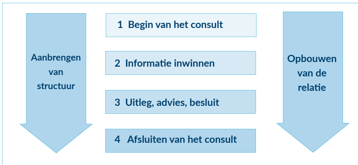
Figuur 1. Schematische weergave van de opbouw en fasen van een consult volgens het Calgary-Cambridge-model.

De apotheker voert het farmaceutisch consult volgens een vaste opbouw. Deze vaste opbouw is gebaseerd op het Calgary-Cambridge-model [noot 6 Calgary-Cambridge-model, zie figuur 1]. De apotheker voert het consult als geheel uit volgens de hieronder genoemde fasen, oftewel alle fasen worden doorlopen tijdens het consult.